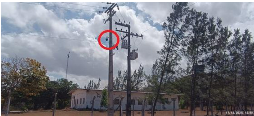
Instalação de câmera PTZ Dome no Gate Administrativo Leste/Setor II