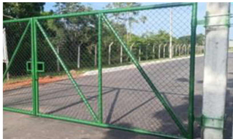
Substituição do portão do Gate Administrativo Leste/Setor II