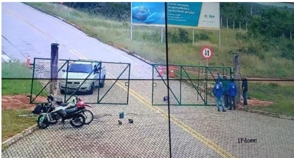
Instalação do portão do Gate Administrativo Oeste/Setor II