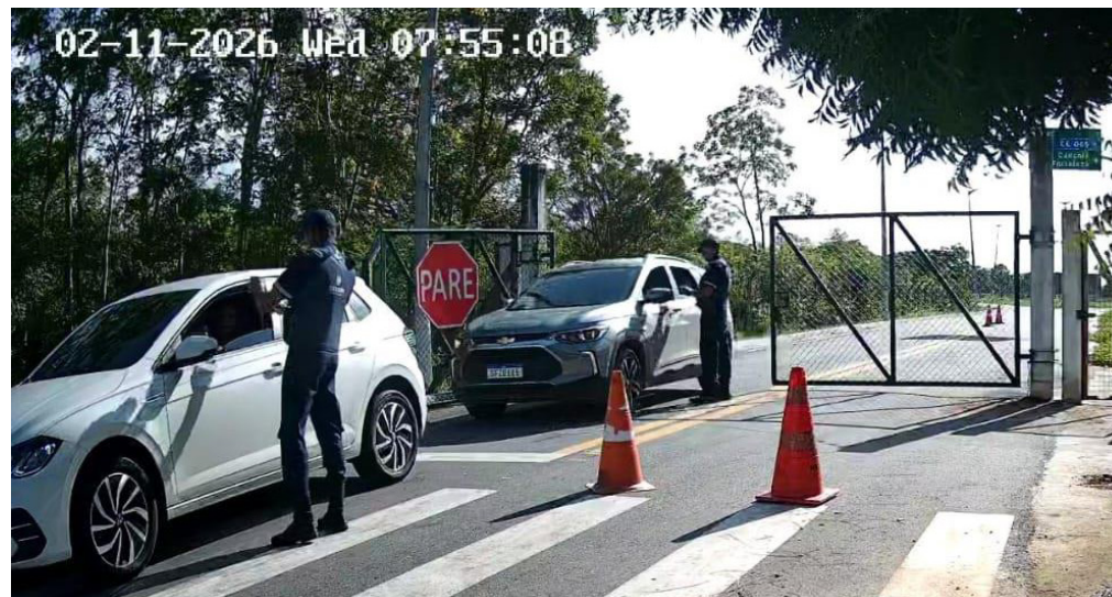
(Aquisição de 08 smartphones Samsung A36 para utilização no controle de acesso por meio do SICA Mobile)