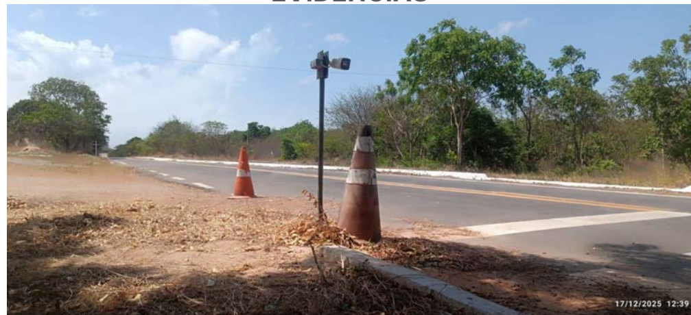
(Instalação do portão do Gate Administrativo Oeste/Setor II)